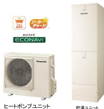
ヒートポンプユニット